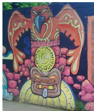
Cra. 51b al frente de confama de Aranjuez.

Con respecto a la parte estética de éste grafiti, a todos nos pareció bastante interesante la manera cómo el autor utiliza las tonalidades y cómo hace el uso del aerosol para lograr esto.