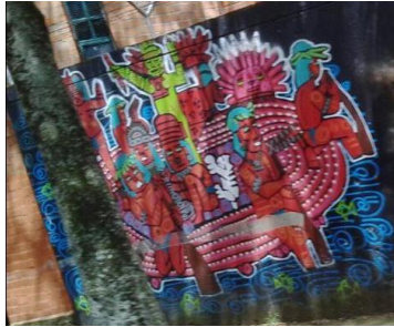
Cra. 51b al frente de confama de Aranjuez.

un dibujo a la misma, haciendo una especie de énfasis en la unión de esta debido al modo en el que el artista procura poner una serie de representaciones una encima de la otra, aunque cabe destacar, que es complejo conocer el verdadero significado de un grafiti pues hay grafitis que tienen mensajes codificados y también hay algunos con doble contenido, por último podemos agregar que al parecer el grafitero utilizó la técnica de aerosol.