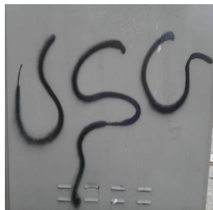
Ubicación: Calle 31 barrio la florida

En un comienzo, tomamos este grafiti como un mensaje que una persona realizó como una marca o un mensaje que representaba un estilo en específico, sin embargo pudimos apreciar estas mismas siglas en otras partes del Valle de Aburrá, específicamente en Niquia, cerca al polideportivo Tulio Ospina, un lugar público en donde seguramente muchas personas han tenido la oportunidad de apreciarlo. Por tanto creemos que este puede ser utilizado por algunos miembros de un grupo o comunidad de grafiteros para distinguirse ante los otros.