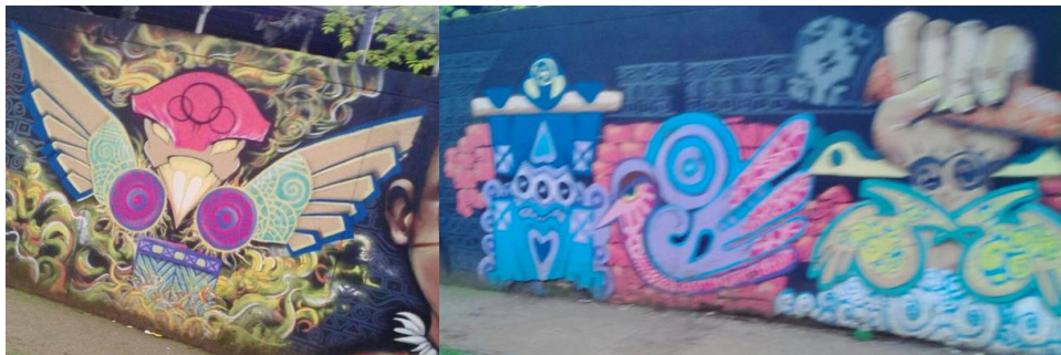
Cra. 51b al frente de confama de Aranjuez.

En estos dos grafitis se puede ver reflejada la técnica del aerosol, en estos grafitis, a comparación de los grafitis populares, tienen muchos detalles y diversos colores.