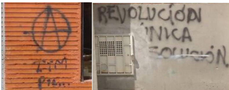
Villanueva Palacé con Maracaibo

Además a pesar de ser una sola palabra o letra, estas generan una crítica bastante controversial al estado y al pensamiento de los ciudadanos.