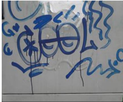
Ubicación: Calle 31 barrio la florida.

como se mencionó anteriormente puede que lo que percibimos no sea lo que realmente significa.