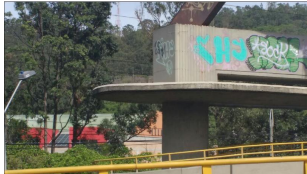
Puente de plomada

Adicionalmente, se podría afirmar que dicho grafitti podría considerarse un acto de vandalismo, debido a que el lugar en donde está situado es un lugar bastante cultural y no apto para este tipo de arte.